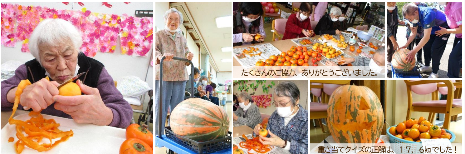
たくさんのご協力、ありがとうございました。

軒先でどんどん大きくなった「アトランティックジャイアント」。収穫後しばらく愛でて、ハロウィンに合わせて加工してみました。