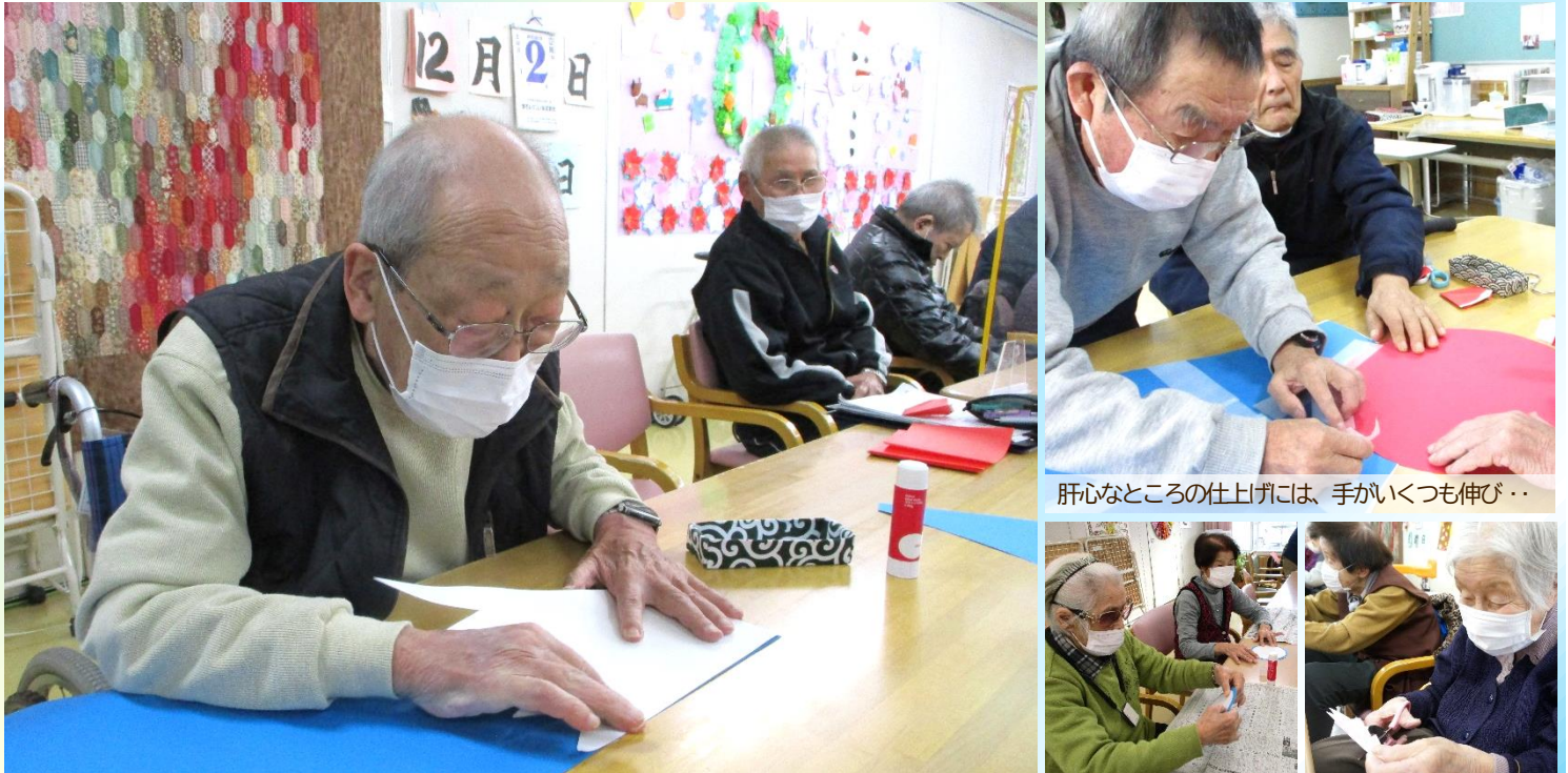
肝心なところの仕上げには、手がいくつも伸び・・・

指をほぐす体操から始まって。クリスマス用に、ポインセチアの花と雪の結晶を、折り紙を切って作りました。お正月向けに用意した壁画素材は、青と白の画用紙を切り貼りして作る波模様に、大きな富士の山と「お目出鯛」。年末年始のデイを華やかに飾りました。