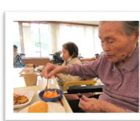
7/10 季節のフルーツ (赤肉メロン)